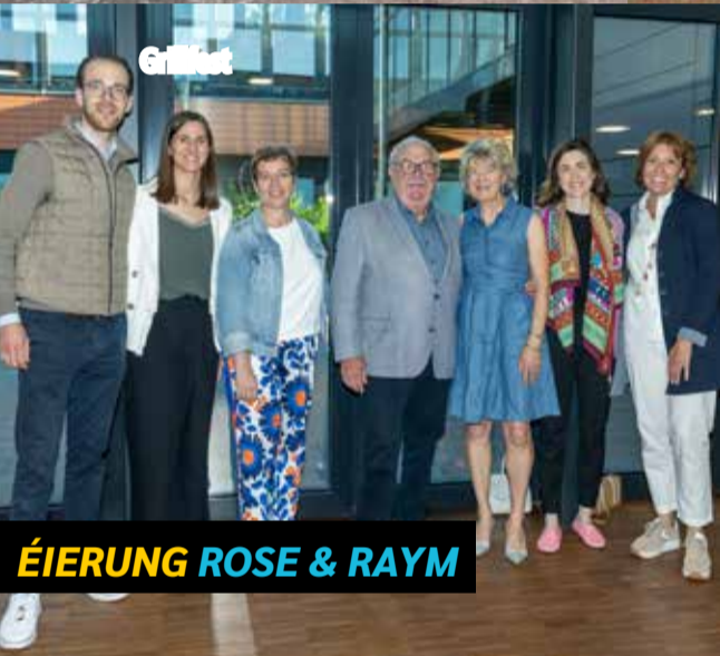
ÉIERUNG ROSE & RAYM