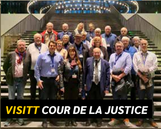
VISITT COUR DE LA JUSTICE